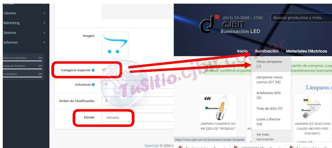
Figura 2: Categoría en la barra principal.

Luego de cargar todos los datos no olvidar presionar el botón de GUARDAR,