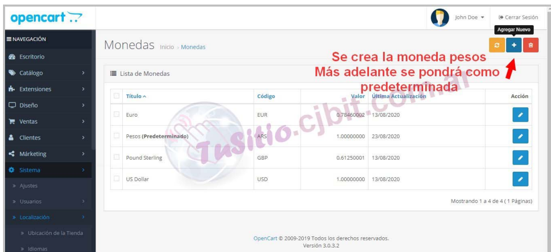
Figura 3: Crear moneda Pesos.

Para crear una nueva moneda, en este caso se crea la moneda Pesos, a la cual se le asignará el símbolo $, debe ingresar a 'Sistema/ Localización / Monedas' (Figura (3)). Si solo trabajará, como es en este caso en pesos, deberá deshabilitar el resto de las monedas. Para que no aparezcan en el sitio.