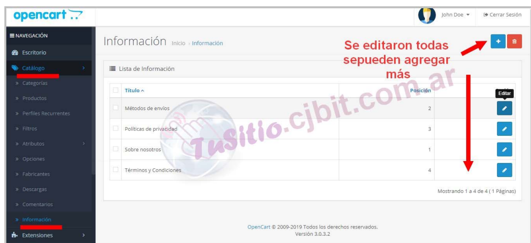
Figura 1: Renombrar la información.

Ir a 'Catálogo/ Información'. Para crear un nuevo registro de información presionar en el '+'. Para editar el nombre de la información, al idiona deseado, presionar sobre el Lápiz de editar (Figura (1)).