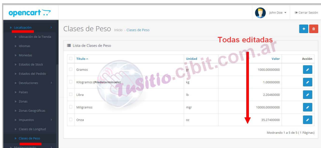
Figura 5: Modificar a Kilogramo, gramo, miligramos.

Crear o editar, al idioma deseado, una nueva variable de peso, la cual se guarda en la base de datos por lo cual no se traduce. En este caso se modifica a kilogramo, gramos, miligramos, para ello, se debe dirigir a 'Sistema/ Localización/ Peso' (Figura (5)).