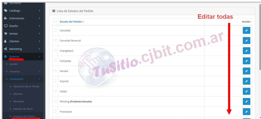
Figura 2: : Renombrar estados de pedidos.

Se deberá editar cada uno de ellos y colocar el SEO, Como usar el SEO de explica en el manual de ayuda para el módulo SEO. Ver a partir del Capítulo 1.3, de este enlace.